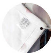
周囲は三巻縫製 (メローも対応可)